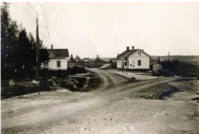
Haminan ja ympäristön Osuuskauppa Koskensillan myymälä No 8

Maistiaisia Tykän tuulimyllyllä toukokuussa olevasta valokuvanäyttelystä.