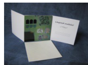
2-osainen kortti "maalaus"