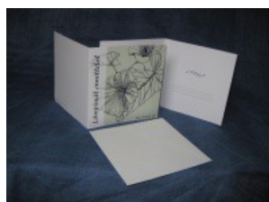
2-osainen kortti "elämänlanka"