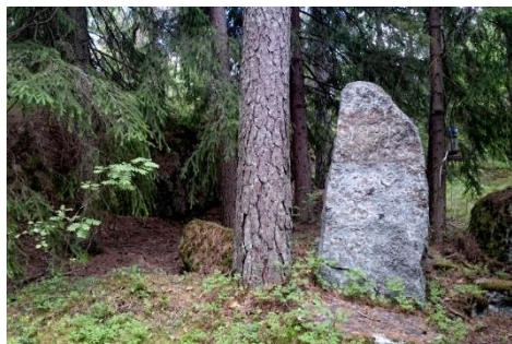
Pakokivi nykyisin- kuva Ilmo Suurnäkki

TOK:n talolla on esillä vanhoja sekä "uusvanhoja" valokuvia sukuseuran historiasta, suku tuotteita on myynnissä sekä sukutietojen tarkistamiseen ja täydentämiseen on varattu myös mahdollisuus.