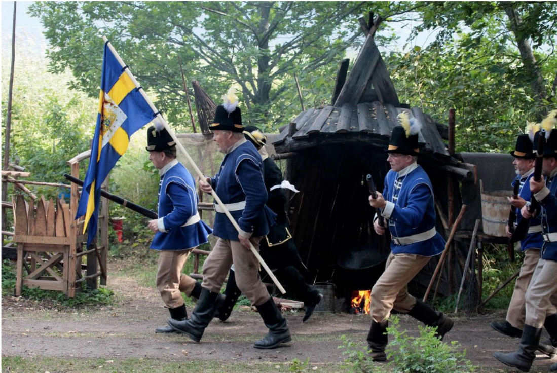
Sukuseuramme kesätapahtuma järjestettiin vuonna 2015 seuraamalla Kansanoopperaa Kustaan sota Anjalassa

Sukuseura on kiitollinen kaikista muistakin esityksistä joilla saadaan koottua sukua yhteen rennosti kuulumisia vaihtamaan ja viettämään aikaa toinen toistemme kanssa.