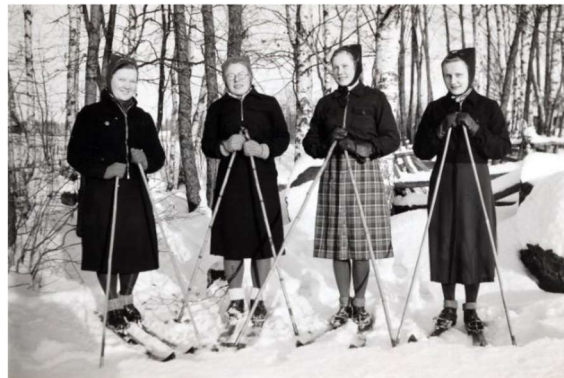
Hiihtäjätyttöjä Kannusjärvellä.

Tiesitkö että edesmennyt valokuvaaja Armas Uusnäkki (taulu 2223) kuuluu sukuunne!