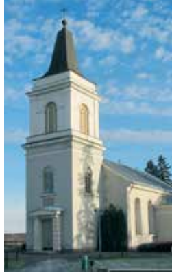
Marian kirkko muistetaan hyvin Vehkalahtelaisten kotikirkkona.