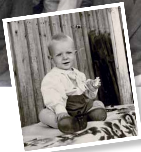
Markun lapsuuskuva vuodelta 1947.