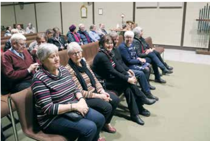
Sukulaisille oli varattu eturivin paikat