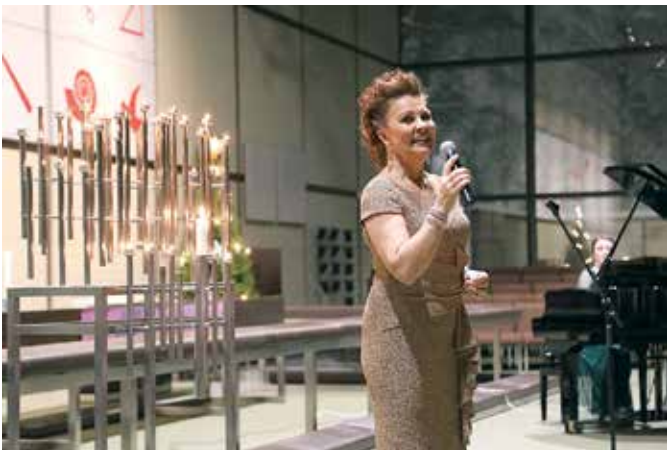
Kouvolan keskuskirkko antoi hienot puitteet joulukonsertille