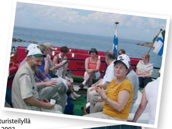
Kotiseuristeilyllä vuonna 2003