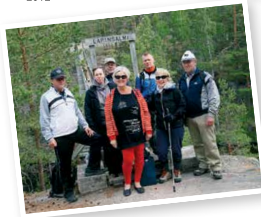
Sukuseuran hallitus piti kävelykokouksen Valkealan Repovedellä vuonna 2016