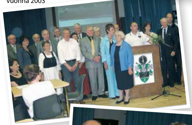
Sukujuhlan osanottajia vuonna 2009