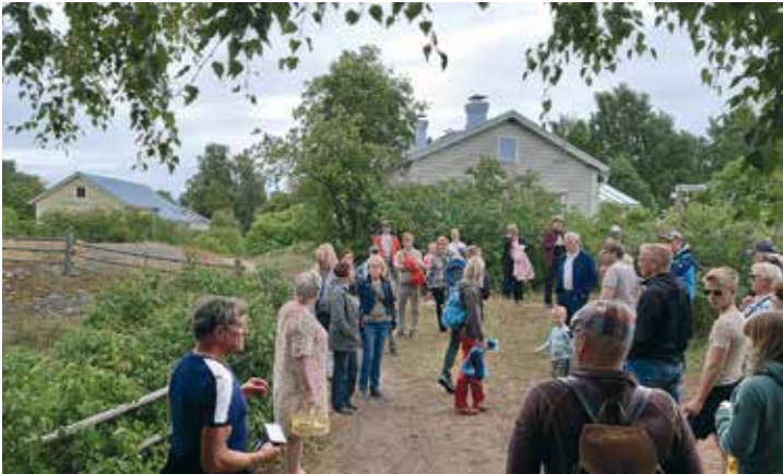
Tammioon käytiin tutustumassa kesällä 2022

Muistutus jäsenistölle: Ilmoittakaa muuttuneet tietonne joko sähköpostilla yllapito@suurnakki.fi tai sukuseuran kotisivuilta ladattavalta lomakkeella.