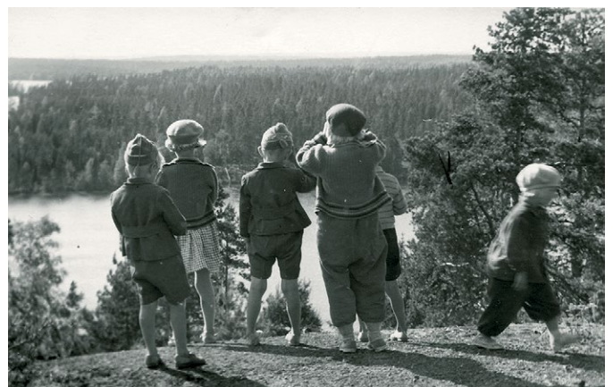
Lapset tähyilevät maisemia Siliävuorelta.